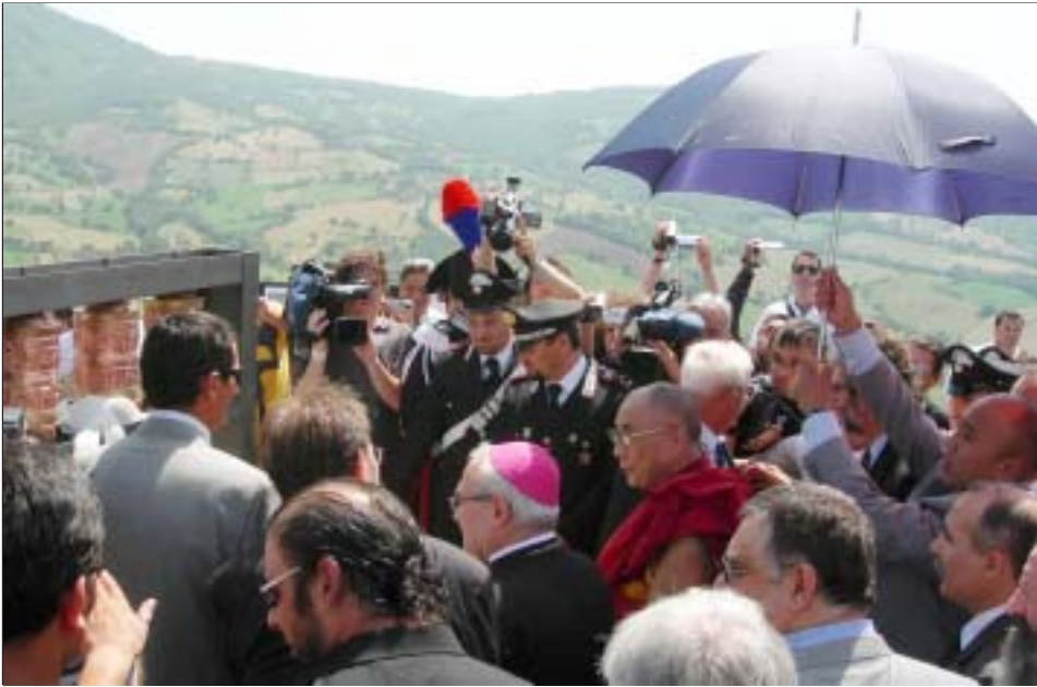
ཡགོང་ས་མཆོག་ལ་ཡེ་ལྷི་ཟླ་ཆེན་ནས་རིམ་བུ་དང་མཆི་ལག་བསྐྱོར་གྱི་བྱ་རྒྱུ་དང་མཆི་སྐྱེན་བསྐྱར་བྱེད་བཞིན་པ།

དེའི་ངོ་འབྲེལ་གྱི་དང་། ལྷི་ཚོང་ཆེ་ཙམ་ཡོད་པའི་མཆི་ ཆེན་དང་། མྱོང་ཁྲེར་གྱི་ཞི་དག་དཔོན་རིགས། ཡེ་ ལག་བསྐྱོར་ཁ་གསལ་བཞེངས་ཏེ་བོད་དང་མི་ཉེ་ལཱའི་ བྱ་དང་། ཁ་ཆེ། རང་པ་སོགས་ཀྱི་ཆོས་ལུགས་རིས་