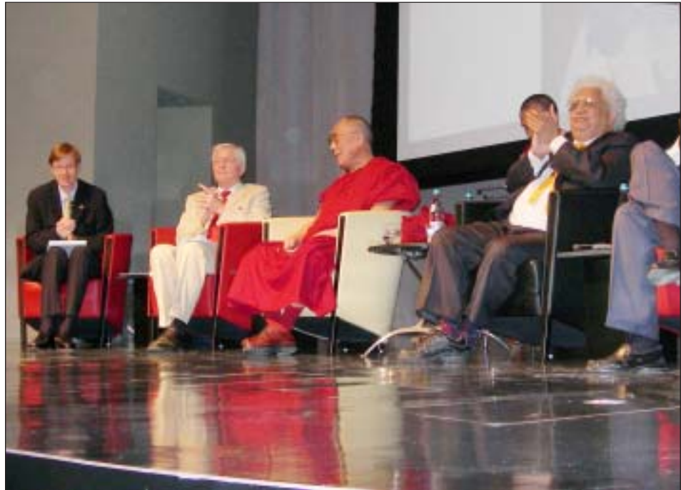
ལགོང་ས་ལ་སྐྱབས་མགོན་ཆེན་པོ་མཚོགས་པའི་འཛམ་གླིང་གི་དཔལ་འབྱོར་རིག་པ་མཁས་ཚན་ཚམས་ཞིབ་བརྗེས་ཀྱི་གནང་བཞིན་པ།

སྤང་གི་དགོངས་འཆར་སོགས་བཟོ་སྒྲིང་ལམ་ནས་བརྗོད་ ལེན་གནང་ཞིང་། ལགོང་ས་ལ་སྐྱབས་མགོན་ཆེན་པོ་ མཚོགས་ནས་དཔལ་འབྱོར་རིག་པ་མཁས་ཚན་ཚམས་ དང་རྒྱལ་སྤྱིའི་མངལ་ལྷུ་གཞན་པ་ལྟེང་ལྟེང་པའི་ དཔལ་འབྱོར་ལས་དོན་གྱི་ལས་རིགས་པའི་མཁས་པའི་ སྐྱེ་ཚབ་མི་གུངས་ ༥༠༠ བརྒྱལ་བར་རྒྱུན་གྱི་ཐུགས་ བཞེད་རྩེད་དུ་མའི་ལམ་གྱི་དཔལ་འབྱོར་གྱི་རྩ་གྲུབ་ དང་རིག་ལམ་སྐོར་བཀའ་སློབ་རྒྱ་ཆེ་རྩལ་བ་དང་། རྩལ་པར་ཉེ་བའི་འཛམ་གླིང་ནང་གི་ཆེན་དང་། རྒྱལ་ ཁབ་ལྷུ་གཞན་པ་ལྟེང་ལྟེང་པའི་མོགས་སྤྱི་ཚོགས་གང་དུ་ཡིན་ཡང་ དཔལ་འབྱོར་གྱི་མཐའ་གཉིས་སུ་སྤྱོད་པའི་གནས་ཚུལ་ཉིན་ བཞིན་ཆོད་ཆེ་རུ་འགྲོ་བཞིན་ཡོད་པར་མ་ཟད། དཀའ་ངལ་དེ་དག་ཞི་འཛམ་གླིང་གི་ཞི་བདེ་བརྟན་སྤོང་ དང་། རྒྱལ་མཐུན་གོང་འཕེལ་གྱི་འགོ་བརྒྱུད་པར་གྱུར་ བཞིན་ཡོད། རྩལ་པར་དཔལ་འབྱོར་གོ་ལ་ཅན་དང་།