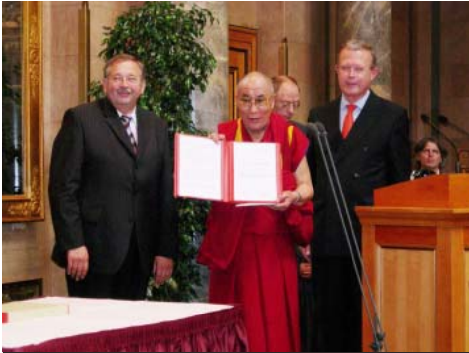
ལམོང་ས་ལྷུ་བས་མགོན་ཆེན་པོ་མཚོག་ཞི་བོད་མིའི་གཞེངས་ཉུགས་དབུ་ས་བཞེས་གནང་བཞིན་པ།

ཐག་གཙོད་ཡོང་ཐབས་གནང་བཞིན་པ། དེར་རྒྱབས་ ཆེན་དགོངས་པ་དེ་འདྲ་བཞེས་ལུ་མཁུ་འཛུམ་འཛུམ་སྐྱིད་ ནང་ཕོན་དུ་སྟོན་དཀའ་བར་བརྟེན། ཐབས་ལམ་དེ་ དག་ནི་དུས་རབས་འདིའི་འཛུམ་སྐྱིད་ལའང་དཔེ་སྟོན་