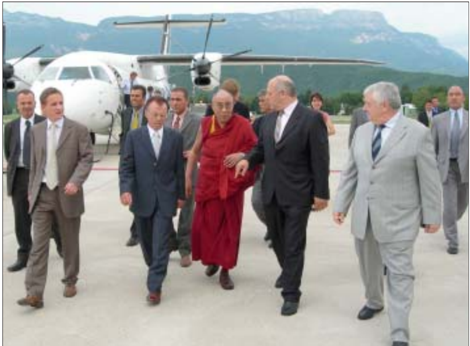
ཡཱ་ཁོང་ས་མཚོག་སློབ་ཞོན་པ་རང་སྐྱོང་གི་སྲིད་འཛིན་སོགས་དཔོན་རིགས་ནས་གནས་ཐང་དུ་སེབས་བསྐྱར་ཞུ་བཞིན་པ།

ཡཱ་ཁོང་ས་ཡ་སྐབས་མགོན་ཆེན་པོ་ཆེབ་སེམས་ལྷོ་མ་ བ་སོགས་ཞི་དྲག་དཔོན་རིགས་ཁག་གཞུང་འབྲེལ་ འཁོར་ནམ་པ་སློབ་ཞོན་གནས་ཐང་དུ་ཆེབ་སེམས་སྐུར་གནང་ སེབས་བསྐྱར་བཅར་ནས་ཡཱ་ཁོང་ས་མཚོག་མངའ་ཁུལ་