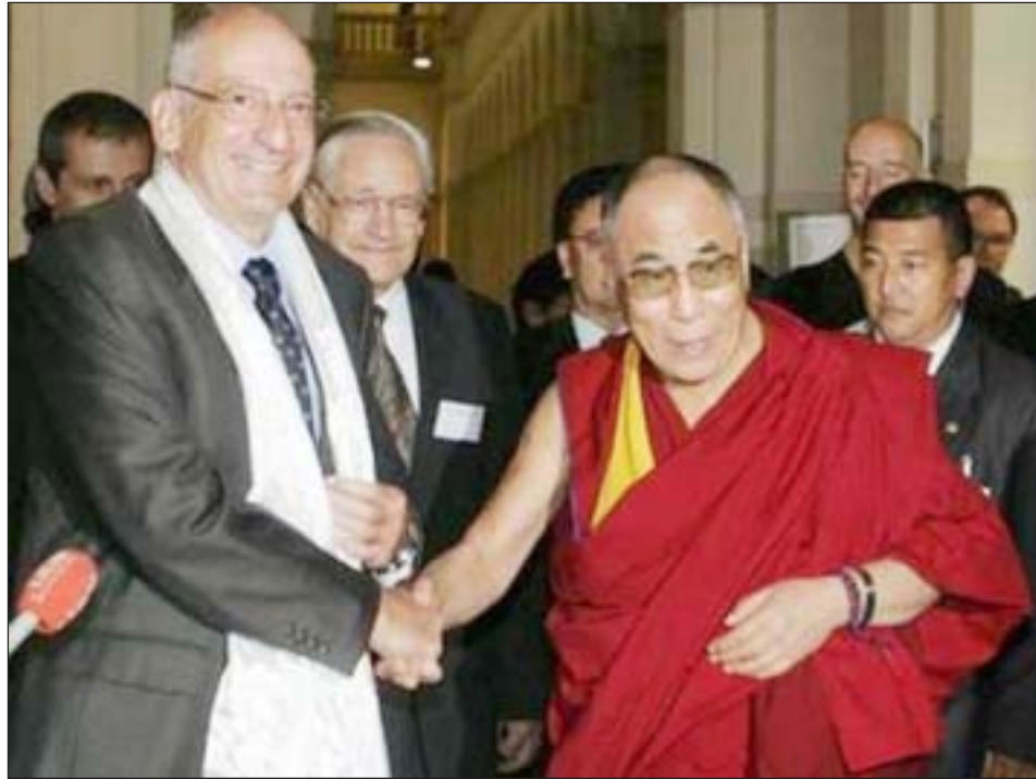
ཡགོང་ས་ཡ་སྐབས་མགོན་ཆེན་པོར་སྲུང་སི་ནང་སྲིད་སློན་ཆེན་ཅན་གྱིས་བསུ་སྐྱེ་ལེན་ཞུ་བཞིན་པ།

འདུལ་རིགས་སློབ་གྲྭ་ཆེན་མོའི་ཚན་རྩལ་ལྟེ་གནས་ཁང་། ཆེན་སྐུ་ཞབས་ Pascale Couchepin གཞུང་། གིས་གནད་ཁུལ་ལྟར་ཆེབས་སྐུར་གནང་སྐབས་མངའ་། འབྲེལ་མངའ་ཁང་། བཅར་ནས་ཡགོང་ས་ཡ་སྐབས་