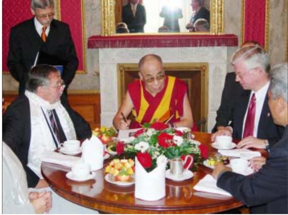
ལ་ལོང་ས་ལ་སྐབས་མཐོན་ཆེན་པོར་སྲིད་སྡེ་དང་གོ་ས་ཚོགས་ཚོགས་གཙོས་ཞིགས་ཇའི་སྡེ་ལེན་ལྷན་གྱི་ཞི་བདེ་

ཀྱིས་སྐོར། ལྷན་གྱི་དྲུས་བཟང་དང་བོད་དོན་ཐད་ཀྱི་བ་ རྒྱུང་ལུ་སྡེ་འཛིན་སོགས་ཐད་དགོངས་འཆར་བཞེ་ལེན་ ལྷན་ཆེ་གནང་ཞིང་། ལ་ལོང་ས་མཚོག་གི་བཀའ་སློབ་ དང་། ལས་རིགས་མཁས་པ་རྣམས་ཀྱི་ཉམས་སྲོལ་ རས་འདི་གཉེན་སྲིད་སྡེ་འཛིན་གྱི་དགོངས་འཆར་ མངའ་སྡེ་ཞིག་གྲུང་བ་མངའ་སྡེ་འཛིན་གཞུང་གིས་རང་རྒྱལ་ ཁབ་ནང་དང་། འཛམ་གླིང་ཁྲིམ་ཞུ་ལ་སྡེ་ལ་གྱི་ ལས་འགུལ་ལྷན་ཆེ་སྲིད་ལྷན་ལྷན་གྱི་དོན་ལྡན་ ཁང་དུ་ཆེ་བས་སྐྱུར་གནང་འདུལ་ཏེ་སེན་ཞི་བདེའི་ གཞེངས་ཉམས་སྲིད་ལས་ལྷན་ལྷན་གྱི་འགན་འཛིན་ས་ གནས་ལོ་ཚེས་ཀྱི་ཚོགས་གཙོས་དབུས་ལོ་ཚེས་ ཁབ་དང་། གཞེངས་ཉམས་སྲིད་ཚོགས་ཀྱི་ཚོགས་གཙོ། མོང་ཁྲིམ་སྲིད་ལྷན་གྱི་ཞི་བདེ་དང་དཀའ་ཚོད་གཞི་བ་ འདུག་ཏེ་སེན་ཞེ་གནས་ཁང་གི་འགན་ཁུར་བཅས་ ཚོགས་མི་མི་གངས་། ༡༥ མངའ་འདུན་ཐོག་གཙོ་ བོད་དང་སྐབས་འཛམ་གླིང་ནང་འཛིན་སྲིད་སྡེ་ལྷན་གྱི་