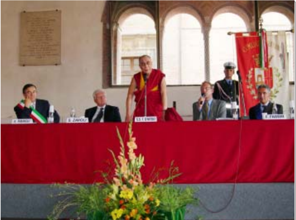
ལ་གོང་ས་མཚོག་གི་ཕྱོང་ཁྲེའ་རི་མོ་ཁོའི་སྤྱི་ཁྲེའ་ས་ཁྲེའ་ས་ལེབས་ལེབས་སྤྱི་བར་གནང་བཞིན་པ།

ནང་བརྒྱུད་དང་སྤོང་བཞིན་པོའི་མངོད་འཕྲིན་ལས་ བརྒྱུ་སྤོང་ལམ་རྒྱུ་དང་། གཞན་ལང་ཐོངས་དེའི་