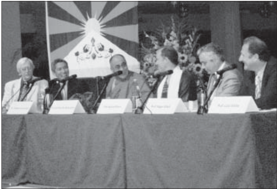
ལྷོ་ཁྱེད་ལོ་ལོ་ལོ་ལོ་ལོ་ ལྷོ་ཁྱེད་ལོ་ལོ་ལོ་ལོ་ལོ་ ལྷོ་ཁྱེད་ལོ་ལོ་ལོ་ལོ་ལོ་ ལྷོ་ཁྱེད་ལོ་ལོ་ལོ་ལོ་ལོ་

༡༥ ལྷོ་ཁྱེད་ལོ་ལོ་ལོ་ལོ་ལོ་ ལྷོ་ཁྱེད་ལོ་ལོ་ལོ་ལོ་ལོ་ ལྷོ་ཁྱེད་ལོ་ལོ་ལོ་ལོ་ལོ་