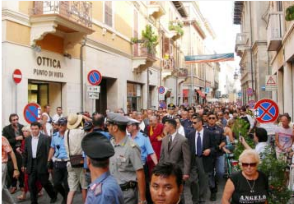
ཡགོང་ས་མཚོག་མི་མེ་ཆེད་སྐྱེ་བྱུང་སོགས་ཞི་དག་དཔོན་རིགས་ནས་བོད་ཀྱི་འབྲེལ་སྟེན་དུ་གདན་ཞུ་གནང་བཞིན་པའི་སྐབས།

གོང་གི་གནང་སྟོན་འཕུལ་གྱིང་ཁྱེད་ཀྱི་སེམས་ལེའུ་ལི་སྐྱེ་བྱུང་ལས་ཁྱེད་ཀྱི་སེམས་ལེའུ་ལ་གདན་ཞུས་ཐོག་ལེགས་འཁོར་ཐོག་གདན་དྲངས་ཏེ་གོང་ཁྱེད་ཀྱི་འཛིན་སྲོང་གཞུང་ལས་ཁང་དུ་ཆེད་སྐྱུར་གནང་སྐབས་སྐྱེ་བྱུང་སོགས་ཞི་དག་དཔོན་རིགས་ནས་གཞུང་འབྲེལ་སྟེ་ལེན་གཟུང་བྱས་ལུས་པ་དང་འབྲེལ་སྐྱེ་བྱུང་དང་། མངའ་སྡེའི་སྲིད་སྲོད་ཀྱི་ཐོས་ཚོགས་འབྲུས་མི། ཞི་དག་ཅན་ཚོར་བདུན་བཙུན་ལ་མངའ་སྡེ་ཐོག་གཅོད་པའི་མངའ་སྲུང་གི་ཡར་ལྷན་དང་། བོད་དོན་ཐོག་ཚུ་བསྐྱོར་ལུ་སྟོན་སྟོར་གཞུང་འབྲེལ་དཔོན་པོ་འཚར་བའི་ལེན་སྐྱེལ་པར་སྐྱེལ།