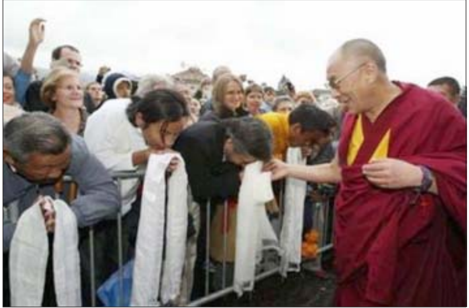
ཡགོང་ས་མཚོགས་ཀྱི་སྐྱོད་ཚུལ་ལྷན་པོ་གནང་སྐབས་སྐྱོད་དང་ལྷན་མི་མང་ནས་གུས་བསུ་གཟབ་རྒྱས་ཞུ་བཞིན་པ།

བར་གང་ལ་དེ་འཚམས་ཀྱི་བཀའ་སྐོབ་རྒྱས་པར་སྤྱུལ། མངའ་འཕྲད་གྲུབ་རྗེས་འདྲུང་འཛིན་སྐྱོང་བའི་རྒྱལ་ཁབ་སྐྱེ་ནང་གི་གསར་འབྲུང་ལས་རིགས་པ་ ༡༠༠ ཉེ་