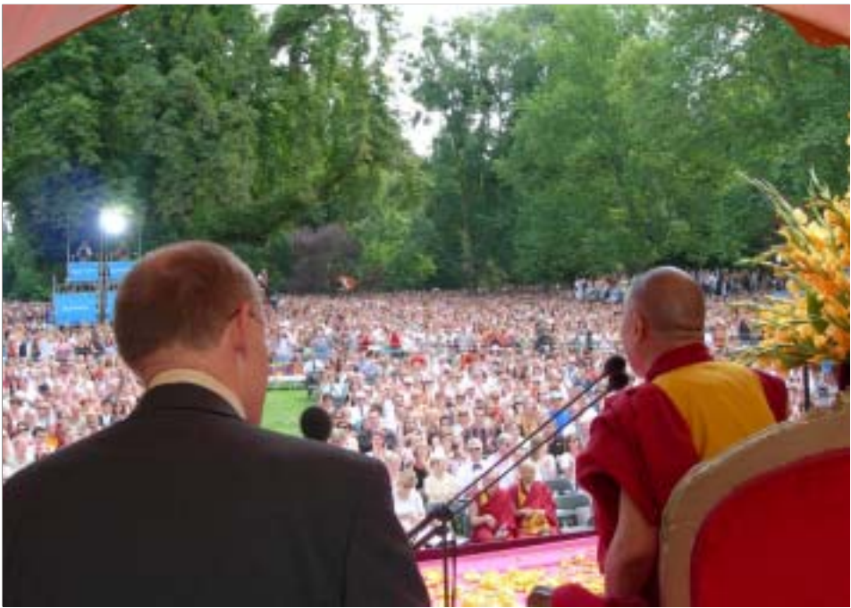
ཡོངས་མཚོགས་ནས་མངའ་སྡེའི་ལས་རིགས་ཁག་གི་མི་མང་ཉེས་ཀྱི་བརྒྱལ་བར་བཀའ་སྐྱོར་གཞན་བཞེན་པ།

རྒྱ་བཅུ་པའི་དྲུས་འགོར་བྲིམ་མཚེས་རྒྱ་ཅན་དམར་པོའི་ གཞུང་ནས་བོད་དུ་དྲག་པོའི་བཅོན་འདུལ་བྱས་ཏེ་བོད་ ཀྱི་ལོ་རྒྱུས་ཐོག་ཞུག་དེ་སྤོ་བའི་དྲག་གནོན་དང་། བོད་ རྒྱལ་ཁབ་དང་། མི་རིགས་ཤིག་གཞུང་། ཁོར་ དུག་བཅས་པར་ལོ་རྒྱུས་ནང་ཚེས་ཐབས་སྐྱེ་གོས་