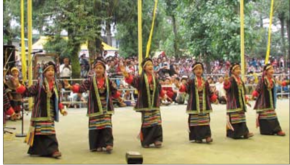
བཞུགས་སྐྱར་དུ་འབྲུངས་སྐྱར་མཛད་སྤོབ་སྐབས་སྤོབ་བྱུག་རྣམས་ནས་དགའ་སྤོབ་ཀྱི་འབྲུབ་སྤོབ་ལུ་བཞིན་པ།

སྤང་བཅི་གཟབ་རྒྱས་འདུག། ཨ་རི་འུ་མ་ཤིན་ལོ་ན་སྐྱེས་ཉར་ཚགས་ པར་གྱི་གསར་འགོད་པ་ཁལ་རོལ་གྱིས་བོད་ཀྱི་