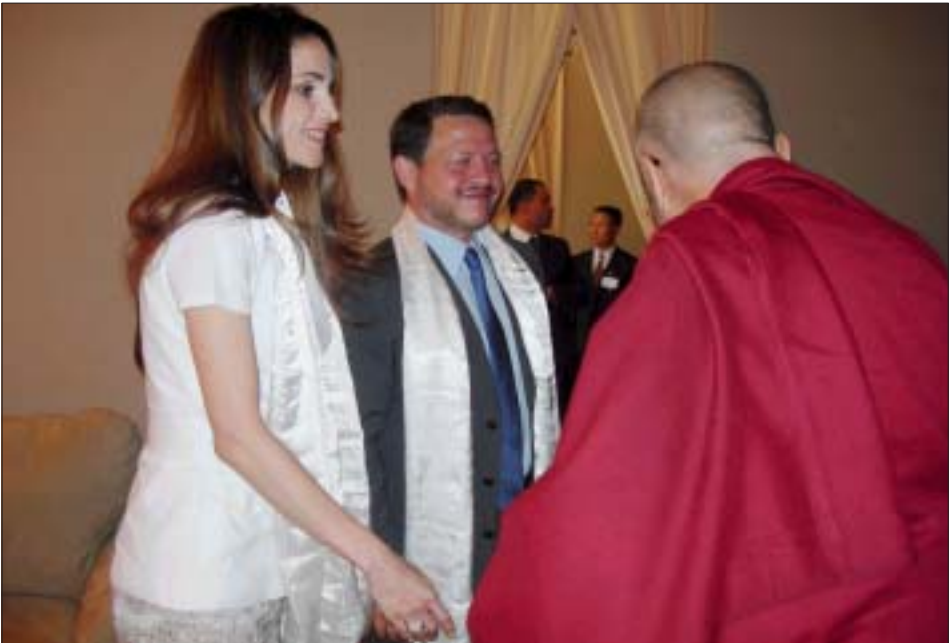
ཡཱོང་ས་ཡ་སྐབས་མགོན་ཆེན་པོ་མཚོག་ལ་རྒྱལ་པོ་ཨ་བ་དུ་ལ་ལཱ་དང་བཅུན་མོ་ནམ་གཉིས་ནས་གུས་བསུ་བྱ་བཞིན་པ།

དབུགས་དབུང་རྒྱ་ཆེ་སྐྱལ་ཉེ་མངའ་མོལ་བྲེངས་ གཉིས་པ་དོན་སྡིང་རྩན་པར་གྱུར་ཡོད།