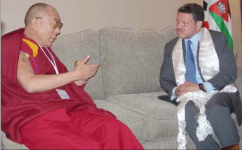
ཡཱོང་ས་ཡ་སྐབས་མགོན་ཆེན་པོ་མཚོག་དང་རྒྱལ་པོ་ཨ་བ་དུ་ལ་ལཱ་ནམ་གཉིས་མངའ་ལ་མོལ་གནང་བཞིན་པ།

བ་དང་། འཇུགས་སྐྱེན་ཡར་རྒྱས། སློབ་གསོ། མི་ ཚོས་རིང་ལུགས་ཀྱི་ལས་དོན། ཚན་ཅུ་ལ་སོགས་ནང་ བྱས་རྗེས་སུ་ལ་དུ་བྱང་བའི་བྲགས་ཅན་མི་སྣ་ ༤༠