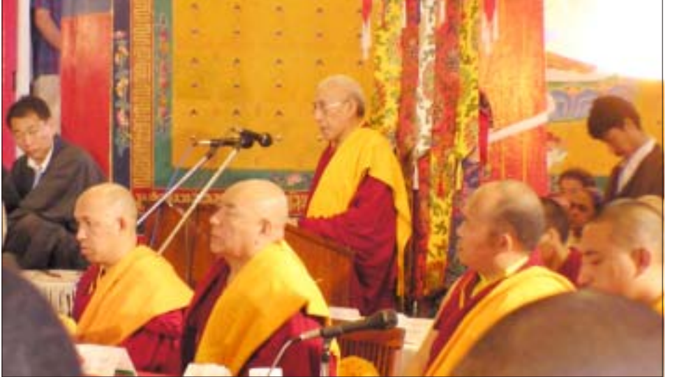
བཀའ་བློན་འབྲེལ་འཕྲིད་འཛིན་པོ་ཆེ་མཆོག་ནས་བོད་གཞུང་བཀའ་བཟུང་ཤིག་གསུང་བཤད་གནང་བཞིན་པ། པར་ལ་མགོན་པོ།

ཀྱིས་རིས་མེད་ཆོས་ཆོགས་བཟུང་སྤྲུག་དུ་མ་འཛམ་ སྤོང་ཤར་རུབ་ལུལ་སྐྱེ་ཁག་དུ་ཚུགས་ཏེ་རྒྱལ་བཟུང་ རིན་པོ་ཆེ་དར་བྱེད་ཡོང་བཞིན་པ་འདི་བཞིན་ཆོགས་