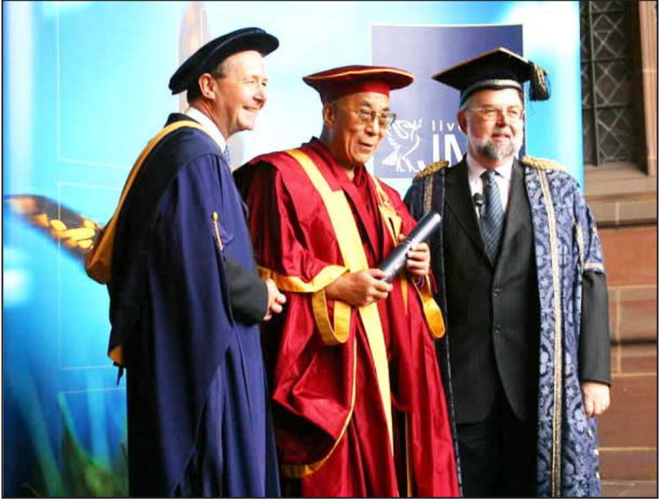
རྗོད་སྤོབ་ལུག་ལག་སྤོབ་བྱ་ཆེན་མོས་སྤོབ་དཔོན་ཆེན་པོའི་ཕྱག་འཁྱེར་འབུལ་བཞེས་སྤྱོད་སྤྱོད།

བཞིན་ཁུར་དེའི་སྤོབ་བྱ་ཁག་གི་སྤྱོད་འབྲས་ཚུར་གསོན་ གྱི་སྤོབ་སྤྱོད་བཞི་བརྒྱ་ཐམས་པར་མཇུག་པའི་ཐོག་སྤོབ་ སྤྱོད་ཆོས་ཤེས་ཡོན་གྱི་རིན་ཐང་ལྟ་བུ་དང་། མི་ཚེའི་ རིན་ཐང་ལྟ་བུ། མིའི་རིགས་ཀྱི་འཚོ་གནས་ཀྱི་ཉེན་ འབྲེལ་སྐོར། རང་ཚོས་ཀྱི་ཉམས་ལེན། བོད་དོན་སྐོར་