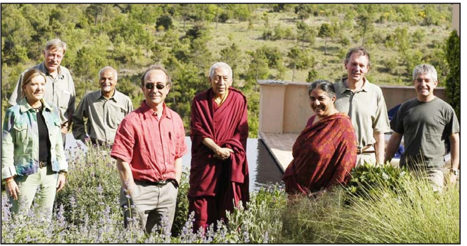
རྟེན་སི་མོང་ཁྲིའི་མགོན་པོ་བདག་ཚོགས་ཀྱིས་བཀའ་ཁྲིའི་མཚོགས་ལ་དེ་གའི་ཁོར་ལུག་གནས་སྤོ་བའི་སྤོ་བའི་གནང་བཞིན་པ།

གསྤོ་བའི་མང་བསར་ཡིན་པའི་གནས་ཚུལ་སོགས་ཚབ་ སྤོ་བའི་དང་། ཡང་རང་གཞུང་ནས་རྒྱ་བལ་འབྲུག་ གསུམ་གཙོ་བོར་གྱུར་པའི་བཅའ་ཁྲིལ་བོད་མིའི་ འདུས་སྤོ་བའི་དབུ་ཁྲིད་བོད་སྤྱི་པའི་སྤྱོད་ལེགས་ དང་། བོད་མིའི་སྤྱི་ཚོགས་སྤོ་བའི་ལས་ནས་འཚོ་ ཞིང་རྒྱུན་གནས་ཡོང་ཐབས་ཀྱི་སྤོ་བའི་དང་། རིག་