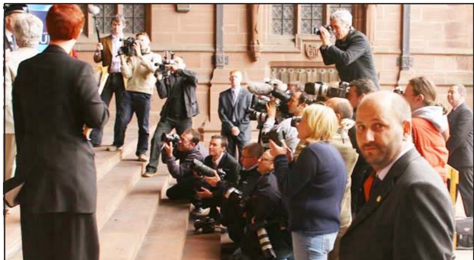
12 ཡལོང་ས་ཡལྱུའམ་མཁོན་ཚེན་པོ་མཚོག་ལ་གསར་འགྲུལ་པས་བཀའ་འདྲི་བྱ་བཞིན་པ།

ཕྱགས་ཚེ་བོབ་ཡོད་པ་རེད། སྤྲོད་ཀྱི་ལམ་ཁྱོད་ཀྱི་བསྐྱེད་པའི་མཇུག་འདུད་འདྲིན་རྒྱུ་ ལྷོ་ཨུག་ ༡༧ ཉིན་གྱི་ཕྱི་ལོ་ལྗོད་ ༢༡༥༤