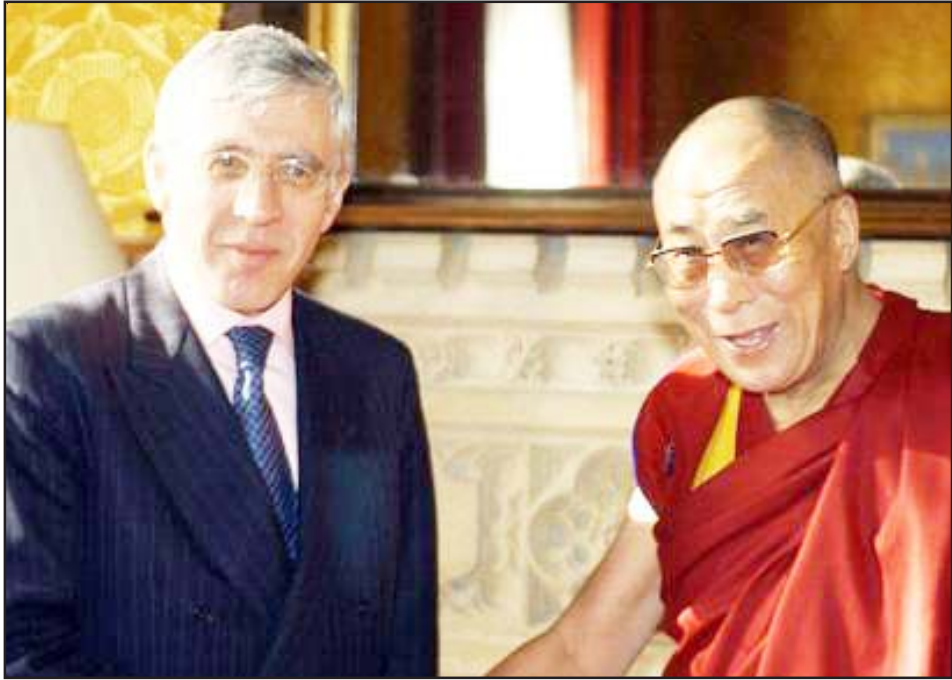
དཔྱིན་ཇིའི་སྲིད་སྡོམ་དུང་ཆེ་མཆོག་ནས་ཡགོང་ས་ལ་སྐྱབས་མགོན་ཆེན་པོ་མཆོག་ལ་སྲིད་ལས་ཁུར་སུ་སྡོ་ལེན་གནང་བཞིན་པ།

ཡུལ་ནི་རང་དབང་མང་གཙོ་རྒྱུན་པའི་རྒྱལ་སྤྱིའི་འགན་ ཁུར་ཡོད་པའི་རྒྱལ་ཁབ་ཅིག་ཡིན་པ་རྒྱར་དཔྱིན་ཡུལ་ ནས་རྒྱ་ནག་དང་བོད་ཀྱི་འགྲོ་བམིའི་ཐོབ་ཐང་དང་། ཆོས་དང་རིག་གནས་སྤྱང་སྦྱོབ། མི་མང་གི་རང་ དབང་དགོས་འདུན་སྤྱང་སྦྱོབ་བྱེད་རྒྱ་ནི་འོས་གིང་། འཚོམས་ལ་འགན་བེད་ཆེན་པོ་ཡོད་པ་དང་། དཔྱིན་ཇིའི་ གཞུང་གིས་བོད་རྒྱའི་བར་དཀའ་ལྷོག་སེལ་བའི་ཐབས་ ལམ་བཟང་གོས་ནི་ཡགོང་ས་མཆོག་གིས་འདོན་གནང་ མཛད་པའི་དབུ་མའི་ལམ་སྤྱོད་ལ་འདོན་ཞིན་གཉིས་ ཀར་རྒྱུན་རིང་རང་བཞིན་དང་། གཉིས་ཕན་གྱི་ཕན་ ཐོགས་ཡོད་པའི་ཐབས་ལམ་བཟང་པོ་ཞིག་ཡིན་པར་ བརྟེན་དེར་དཔྱིན་གཞུང་ནས་རྒྱ་བརྒྱུད་ལྷོ་བཞིན་ཡོད་ ཅེས་གསུངས་ཏེ་ཁོང་གི་བཀའ་མོལ་ཁག་རྟུག་བསམ་ ཐོང་ལེན་ཡིན་འདུག ཡགོང་ས་ལ་སྐྱབས་མགོན་ ཆེན་པོ་མཆོག་གིས་རྒྱ་ནག་གི་རྒྱ་བསམ་ཆེན་མཛད་ཁུར་ གསུམ་གྱི་གནས་ཚུལ་སྤྱིར་བཏགས་དོ་སྡོམ་དང་། དེ་ བཞིན་རྒྱ་ནག་གི་དུས་བབ་སྐོར་དང་། བོད་རྒྱའི་འབྲེལ་ པའི་གནས་བབ། བོད་ནང་གི་རྒྱ་དྲུག་གནས་བབ། རྒྱ་ གཞུང་ནས་བཟང་སྤྱོད་ལ་ལན་བྱུང་ཆེ་བོད་སྤྱོད་ལས་ ནས་སྐྱེ་ཆབ་ཆེད་གཏོང་གི་གྲོས་ཐོལ་གྲུག་ཨང་ བསམ་ཡིན་པའི་གནས་ཚུལ་སྤྱོད་ལྷོ་སྲིད་དུང་ཆེའི་ བཀའ་འདྲི་ཁག་ལ་བཀའ་ལན་སྐྱེལ་ནས་མངའ་འཕྲད་ དེ་རྒྱལ་ཁབ་ཀྱི་རྒྱུན་སྲོལ་གྱི་གནང་སྤོའི་སྡོ་ལེན་རྒྱ་ མ་ཡིན་པར་དོན་དམ་དུ་ཡགོང་ས་ལ་སྐྱབས་མགོན་ ཆེན་པོ་མཆོག་ལ་གྲུས་བརྩེ་ཆེ་མཐོང་དང་། བོད་དོན་ དཀའ་ངལ་སེལ་ཐབས་འགན་ཁུར་ཆེན་པོ་བཞེས་ བཞིན་ཡོད་པ་ནི་སྡོ་ཆོས་གང་ཡང་མི་དགོས་པའི་དེས་ རྙིང་ཆེན་པོ་བྱུང་ཞེས་སྐྱེ་དུང་ཆེ་མཆོག་ནས་དོ་ སྡོམ་བྱུང་། དེས་དཔྱིན་ཇིའི་སྲིད་སྡོམ་མཆོག་མངའ་ འཕྲད་གནང་མེད་པ་དེ་ནི་ཡགོང་ས་ལ་སྐྱབས་མགོན་ ཆེན་པོའི་ཆེས་སྐྱེ་མཛད་འཆར་དང་། དཔྱིན་ཇིའི་ སྲིད་སྡོམ་གཉིས་ཀའི་མཛད་འཆར་དེ་ཅང་རྒྱས་པའི་ དབང་གིས་སྡོན་ནས་མཛད་འཆར་མ་བཞིག་པ་སྐྱེ་ ཆབ་དོན་གཅོད་ནས་ཡོངས་བསྐྱོད་གནང་ཡོད་པ་