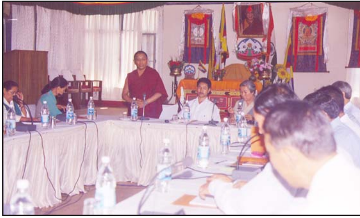
ཆེས་མཐོའི་ཤེས་རིག་འཛིན་སྐྱོང་ཚོགས་འདུ་སྐོང་ཚོགས་གནང་བཞིན་པ།

གཞི་དོན་ཚན་ཁག་གི་ཐད་གོ་བསྟུན་སྐྱོང་བཤད་སྟེ་གྲོས་ཚུལ་གྲུབ་འབྲེད་གནང་བའི་ཤེས་རིག་ལས་ཁུངས་ཀྱི་འབྲེལ་ཡོད་ལས་ཤུལ་ཡོད་པ་རེད། མཇུག་ཏུ་ཆེས་ཤེས་བཞུགས་ལྷོ་མ་ལུ་ལྷན་ལུང་མཚན་གྲངས་མཇུག་པོ་མས་གསུང་བཤད་དང་། ཤེས་རིག་དུང་ཆེས་ལྷན་ལུང་ཆེ་ཆེ་ལྷུ་འགསུང་བཤད་གནང་སྟེ་ཚོགས་འདུ་རྒྱལ་ཁོངས་འབྲེལ་གྲུབ་ཤུལ་ཡོད་པ་རེད། །