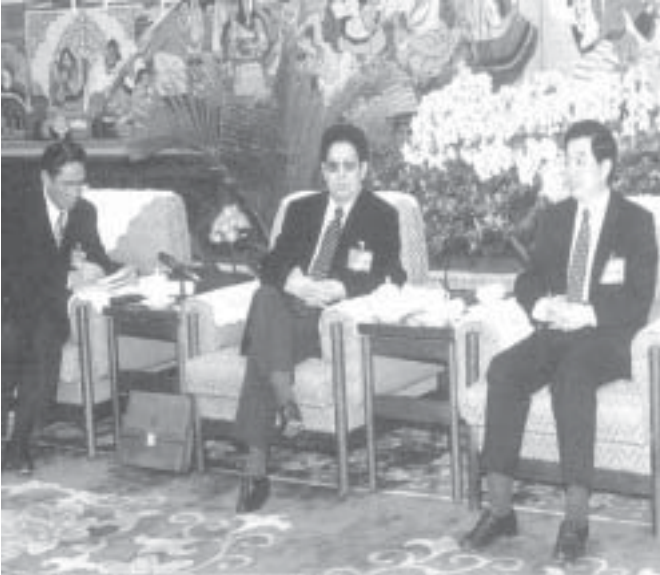
དུའུ་ཅིང་ཐོ་ནས་གཏམ་བཤད་གྱི་འཛིན་པ།

རྒྱུར་བཅོང་འགྲོལ་བཏང་ནས་གསར་གཏོད་རང་བཞིན་དང་ཏང་དབྱེད་ གི་ལམ་སྟོན་མཛུབ་བྱེད་གཉིས་དམ་འཛིན་བྱས་ཏེ་ལྷོ་ཚོགས་ཀྱི་དཀའ་ངལ་ དང་། འགུལ་རྒྱུ་གནད་དོན་རྣམས་ཐག་གཅོད་ཡོང་ཆེད་རང་རྟོགས་ ཀྱི་འགན་ལུས་འདོན་སྤེལ་གྱི་དགོས་ཞེས་སོགས་ངན་སྐྱེ་ལུགས་ཆེ་བྱས་ ཡོད་པ་རེད།