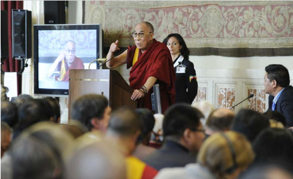
ཡགོང་ས་མཚོག་གིས་རྒྱལ་སྤྱིའི་གྲོས་ཚོགས་ཀྱི་བོད་དོན་རྒྱུ་རྐྱེན་ཚོགས་པའི་ཚོགས་ཆེན་ཐངས་ལྗེ་པར་བཀའ་སློབ་སྦྱུལ་བཞེན་པ།

ཏེ་ལིའི་གྲོས་ཚོགས་ཀྱི་བོད་དོན་རྒྱུ་རྐྱེན་ཚོགས་པའི་ཚོགས་གཙོ་གཞིན་པས་ཐུགས་རྗེ་ཆེ་ཞུའི་གསུང་བཤད་གནང་སྟེ་ཚོགས་འདུ་རྒྱལ་ཁོངས་ལ་གྲོལ།