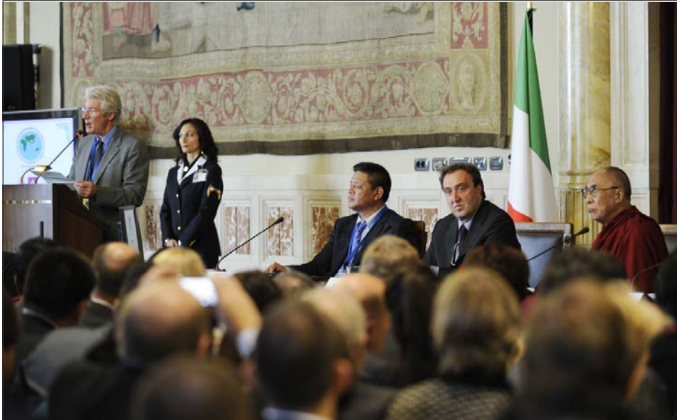
ཨ་རིའི་སློག་བརྒྱན་འབྲུབ་སྟོན་པ་གྲགས་ཅན་རི་ཅེ་ཏེ་ཤེས་ཞེན་སི་ཡི་ལོ་སེས་བཀའ་བའི་གསུང་བཤད་སློགས་སྤྱང་ལུ་བཞིན་པ།

མཉམ་ལུགས་བྱ་རྒྱུ་མེད་པའི་གནོན་འཛུགས་སྤྲད་ཡོད། ཚོགས་འདུ་འདི་ནི་རྒྱ་གཞུང་ལ་ཁ་གཏད་དང་ངོ་རྒོལ་ བྱེད་ཆེད་དུ་ཚོགས་པ་ཞིག་མིན་པར་འདི་ནི་བོད་ཀྱི་ གནད་དོན་ཞི་བའི་ཐོག་ནས་སེལ་ཐབས་ཀྱི་ཞི་བའི་ ཚོགས་འདུ་ཞིག་རེད། ང་ཚོས་ཚོགས་འདུ་འདི་དོན་ དང་ཐུན་བཞིག་ཡོང་རྒྱུའི་རེ་བ་བྱེད་ཀྱི་ཡོད། ཅེས་