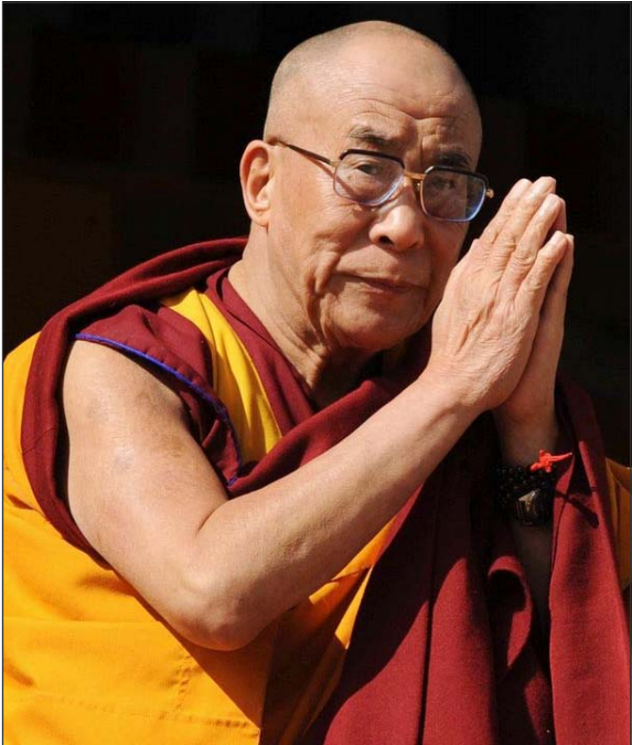
ཡགོང་ས་མཚོག་འབྲུམ་སྡེ་ལར་ཡུལ་མགོན་པོ་ཡགོང་ས་ཡུལ་མགོན་ཆེན་པོ་འབྲིད་སྐབས།

༄༅། གྲི་ལོ་ ༢༠༠༧ ཟླ་ ༡༡ ཚེས་ ༡༣ ཉིན་སློང་པོ་ཡགོང་ས་ཡུལ་མགོན་ཆེན་པོ་མཚོག་མོན་ན་དབང་ཁྲུལ་གྱི་མཇུག་འཕྲིན་ཁག་ལེགས་པར་གྲུབ་ རྗེས་ཨ་རུ་རྒྱ་ཅལ་མངའ་སྡེ་གཞུང་གི་ཐང་འཕུར་གནམ་གྲུའི་ཐོག་མཁའ་ལམ་བརྒྱད་འབྲུམ་སྡེ་ལར་ཆིབས་ཞུགས་བསྐྱུར། དེ་རྗེས་འབྲུམ་སྡེ་ལར་ཡུལ་མགོན་པོ་