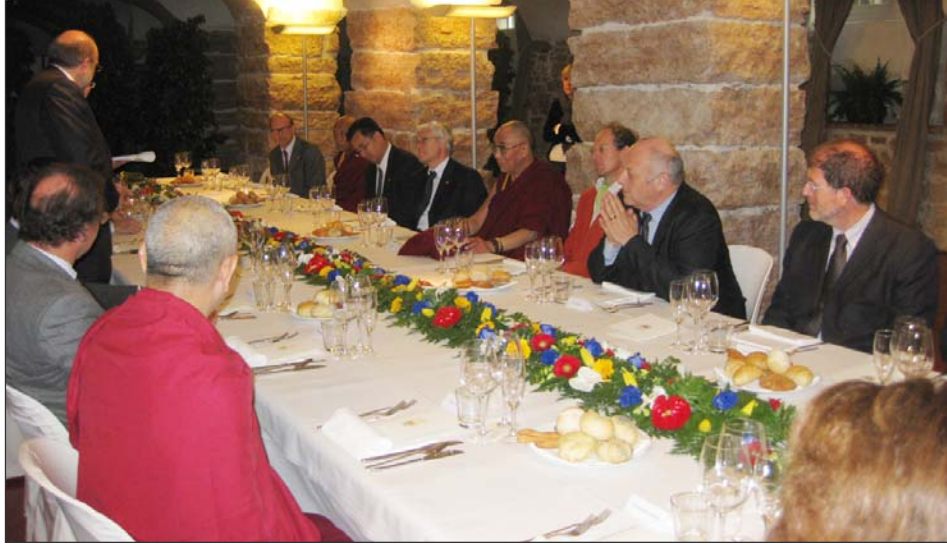
ཏེ་རན་ཏི་སྲིད་འཛིན་ཏེལ་ལི་མཚོག་ནས་ཡུ་རོབ་ས་མཚོག་ལ་གྲུང་ཚོགས་ཀྱི་གསོལ་སྟོན་འདེགས་འབུལ་ལུ་བཞུགས་པ།

སོགས་ཀྱི་སྐོར་བཀའ་སློབ་བཀའ་དྲིན་སྦྱུལ་ཡོད། ལྷ་ཚོགས་གནང་སའི་ཚོགས་ཁང་དེར་མི་གྲངས་ ༡༢༠ ལྷག་ཙམ་ལས་གོང་གི་མེད་པར་སོང་སྤྱི་ལོགས་ སུ་བརྟན་འཕྲིན་ཆེད་བཅུགས་བྱས་ཡོད་པར་མི་མང་ ཏུ་ཅང་མང་པོ་ཞིག་བཅར་ཡོད་པ་རེད། མངའ་རིམ་ དེ་དག་གྲུབ་རྗེས་རང་སྐྱོང་ས་ཁུལ་གཉིས་པ་ཏེ་རན་ཏིའི་ (Trento) ཞེས་པར་ཆེབས་ཞལ་བསྐྱུར།