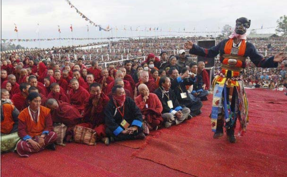
རྟ་དབང་ཡུལ་མི་རྣམས་ནས་ཡགོང་ས་མཆོག་ལ་རིག་གཞུང་མཆོན་པའི་གཞས་སྒྲ་གཟེགས་འབུལ་ལུ་བཞིན་པ།

དེ་ཅང་གལ་ཆེན་པོ་རེད། སྐབས་རེ་མངའ་སྡེ་ཆོར་ དུལ་འབེལ་པོ་ཆགས་དུས་སྒྲོག་ཟ་ལུ་སྲུངས་ཡོང་ མི་སྲིད་པ་མ་རེད། དེ་ཆོའི་གསུལ་ལ་ཆང་མས་ཡིད་ གཟབ་གནང་རོགས་ཞེས་ལུ་རྒྱ་དང་འབྲེལ་སྦྱར་ཡང་ ཆང་མར་ཐུགས་རྗེ་ཆེ་ལུ་བ་དང་ཆབས་ཅིག རོས་ ནས་བཤད་པ་དེ་དག་རྒྱུ་མེད་རྒྱུ་གཏོགས་ཆ་ དྲགས་པ་རྩ་བུ་ཆགས་འདུག་བསམ་གྱི་ཡོད་ན་