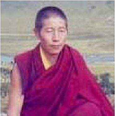
འཇམ་དཔལ་དབང་ལྷུག