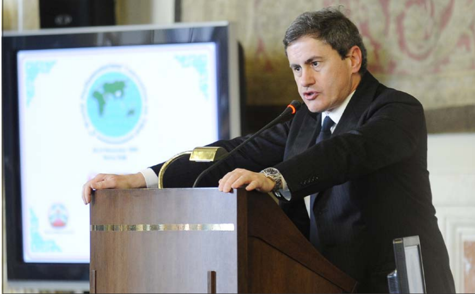
རོ་མ་བྱོང་ཁྲེར་སྤྱི་ཁྱབ་པ་སྤྱི་འབྲུག་ཚོགས་ཀྱི་བོད་དོན་རྒྱབ་སྐྱོར་ཚོགས་ཆེན་ཐངས་ལྷ་པར་གསུང་བཤད་གནང་བཞིན་པ།

སོགས་ཀྱི་གསུང་བཤད་གནང་ཡོད། དེ་རྗེས་སྤྱི་ནོར་ཡུ་མོང་ས་ ཡུ་མཐུས་མགོན་ཆེན་པོ་མཚོག་གིས་བཀའ་སློབ་སྤྲུལ་