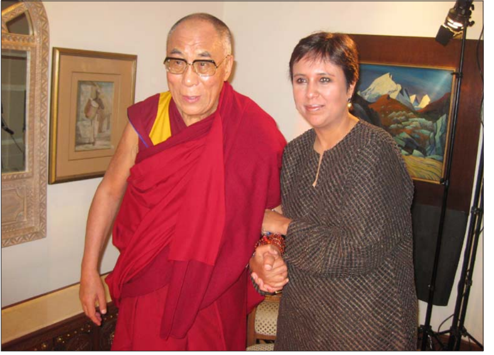
ཡལོང་ས་མཚོག་གིས་ཨེན་ཏེ་ཏེ་མི་གསར་འགོད་པ་ལྷར་ཀཱ་ཏུ་ཏེ་ཏེ་ལ་མཛད་ལ་ཁ་སྐྱོལ་བཞེན་པ།

ཚོགས་དེའི་སྐྱབས་གཏམ་ཁག་སྐྱེད་ཞུས། དེ་ ནས་རྒྱ་གར་རང་དབང་ཞེས་པའི་སྐྱེད་བཞེད་པོད་ ཅིག་དགོས་ཀྱི་ཡོད་པར་ཚང་མས་འབོད་སྐྱེལ་དང་