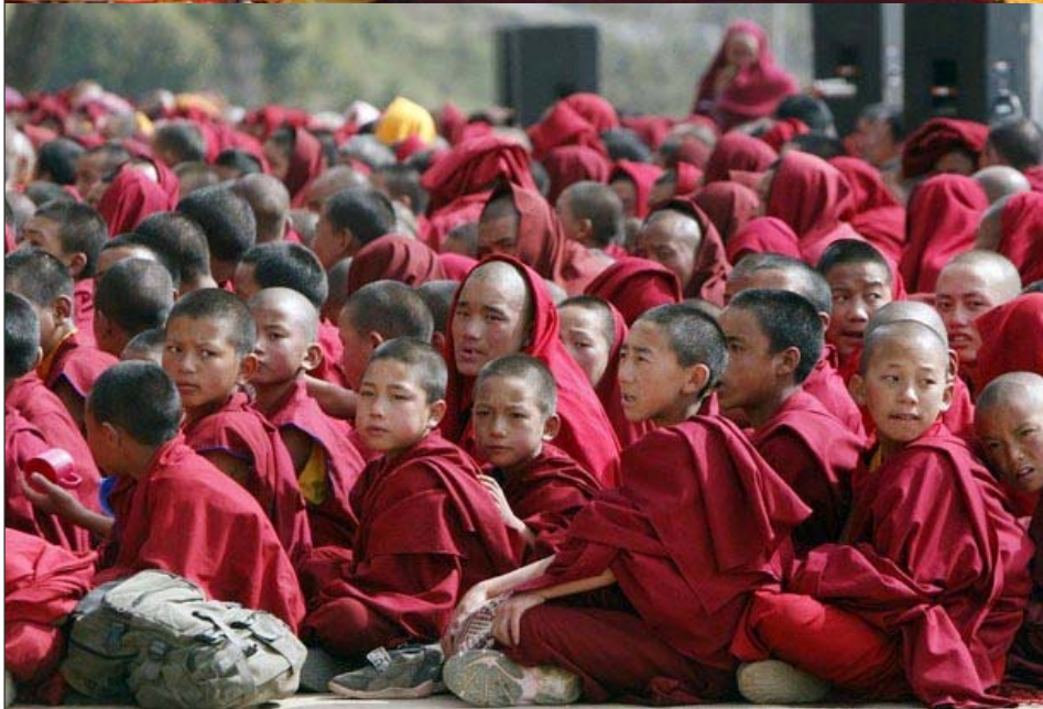
པོ་མོང་ས་མཚོག་གིས་ཚོས་ལུ་བ་རྣམས་ལ་ཁོར་ཡུག་སྲུང་སྐྱོབ་སྐྱོར་བཀའ་སློབ་སྤྲུལ་བ།

འདྲ་ཞིག་གོ་བྱུང་། དེ་ཚོའི་གསུམ་ཀྱིས་ཞིང་ཞི་མོར་བྱ་ རེད་འདུག ང་ཚོ་མི་འཚོ་རྒྱུར་འབྲུལ་ཆས་གལ་ཆེན་ པོ་རེད་དེ་མཐུར་གཏུགས་ན་ཉིན་རེའི་ཟས་ཟ་རྒྱུ་དེ་གལ་ ཆེན་པོ་རེད། བྱས་ཙང་ངོས་ནས་རྒྱ་གཉིང་ནང་ལ་ ཆ་བཞག་ནའང་འདི་འདྲ་དྲན་ཡོང་གི་འདུག འོས་རང་