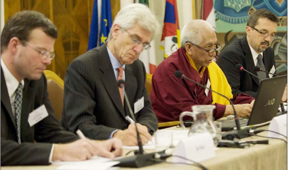
བཅོན་ཕྱོལ་བོད་གཞུང་གི་བཀའ་སྐྱོན་ཁྲིམས་མཚོག་བོད་ཀྱི་རང་སྤྱོད་རང་སྐྱོང་གི་ཚོགས་འདུར་ལྷན་ལུགས་གནང་བ།