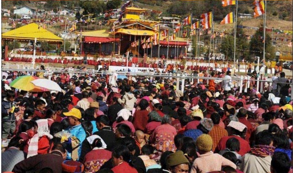
ཡགོང་ས་མཚོག་གིས་སྐུན་རས་གཟིགས་ཐུགས་རྗེ་ཆེན་པོའི་བཀའ་དབང་སྦྲུལ་བཞིན་པ།

པའི་གསུང་ཆོས་བཀའ་དྲིན་ཆེ་བ་སྦྲུལ་སྐབས་འབྲུག་ ནས་བཅར་བའི་དད་ལྡན་ཆོས་ལུ་བ་རྣམས་ལ་ དམིགས་བསལ་བཀའ་སྤོབ་ཐེབས་པའི་ནང་། ལྷོ་