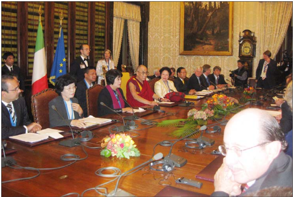
ཡགོང་ས་མཚོ་གཤིས་རྒྱལ་ཁབ་ཁག་ ༡༤ ནས་ཐེབས་པའི་འབྲུས་མི་ ༥༠ དང་རྩོད་དུ་རྩོན་ཚོགས་མཇུག་བཞིན་པ། གཙོ་མཚོག་དང་ཁོང་གི་སྤྱོད་ལྷོ་ལྷོ་ དེ་མེན་སྤྱོད་མགོན་ཁག་ པའི་འབྲུས་མི་རྒྱལ་ཁབ་ཁག་ ༡༤ ནས་ཐེབས་ཡོད་ གཙོག་བཙས་རྩོད་དུ་མཇུག་འབྲུག་རྒྱུ་ཚོད་ལྷོད་ཙམ་ པའི་ཁོངས་ནས་འབྲུས་མི་རེ་བཞུས་པའི་མི་གངས་

འཛིན་མི་སྤྱོད་བཙས་སོ་སོས་ཡགོང་ས་ཡུལ་མགོན་ ཆེན་པོ་མཚོ་གཤིས་ལི་ཏེ་ལིའི་གཞུང་གསུང་བཤད་ ཐེབས་པའི་གྲོས་ཚོགས་ཀྱི་ཚོགས་མི་ ༡༠༠ ལྷག་ ཙམ་ལ་ཐེབས་བསུའི་འཚམས་འདྲི་དང་གསུང་བཤད་ གནང་ཡོད། དེ་ནས་ཚོགས་གཙོ་སྤྱིའི་མ་ཏུ་ཀི་ (Matteo Mecacci) མཚོག་གིས་གསུང་བཤད་ གནང་དོན། ངས་དེ་རིང་ལི་ཏེ་ལིའི་གྲོས་ཚོགས་ཀྱི་ ཚོགས་ཁང་ནང་རྒྱལ་སྤྱིའི་གྲོས་ཚོགས་ཀྱི་པོད་དོན་ རྒྱལ་སྤྱིར་ཚོགས་པའི་ཚོགས་ཆེན་ཐེངས་ལྔ་པ་ཐེབས་ པའི་རྩམ་པ་རྩོན་རྒྱལ་ལ་འཚམས་འདྲི་ལྷོ་ལྷོ་ཡིན། ངས་དེ་འདྲེ་ལྷོ་དགོས་པ་ནི་ལི་ཏེ་ལིའི་གྲོས་ཚོགས་ཀྱིས་ སྤྱོད་མི་ཐོབ་པོད་འབྲུག་ཚོད་དང་འགྲོ་བ་མའི་ཐོབ་ ཐང་གི་གནད་དོན་ཐོག་རྒྱལ་སྤྱིར་ལུས་ཡོད་པ་དང་། འགྲོ་བ་མའི་ཐོབ་ཐང་ཐེངས་བའི་དོན་ལྷོ་བ་མི་ཚང་