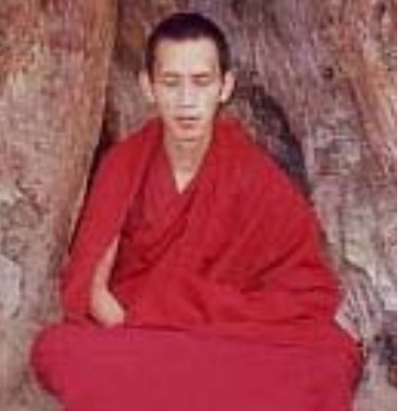
དག་དབང་ཚོས་ཉིད།