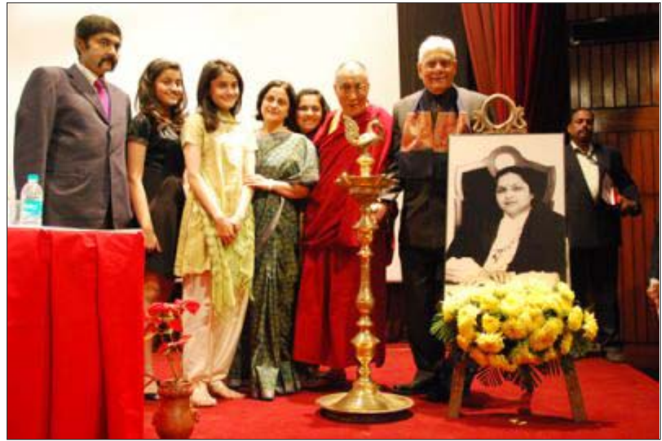
ཡགོང་ས་མཆོག་གིས་སྲིམས་དཔོན་དམ་པ་སུ་ནན་ཏུ་བན་ཐ་རིའི་རྗེས་དྲན་ལ་ཆེབས་སྐྱུར་བསྐྱུངས་པ།

ཉི་མ་ཅལ་མངའ་སྡེའི་སྲིམས་དཔོན་ལི་ལེ་ སེཐ་ པར་ལྷར། ཐངས་འདིར་པོས་ལ་གོ་སྐབས་གནང་ (Leila Seth)མཆོག་ནས་ཐེབས་བསུའི་གསུང་ བཞི་གཞི་བརྗོད་ཆེན་པོ་ཡིན། དེར་སྐབས་ཞི་བདེ་