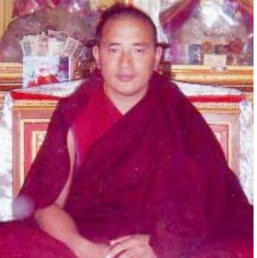
དགོན་མཚོག་ཉི་མ།