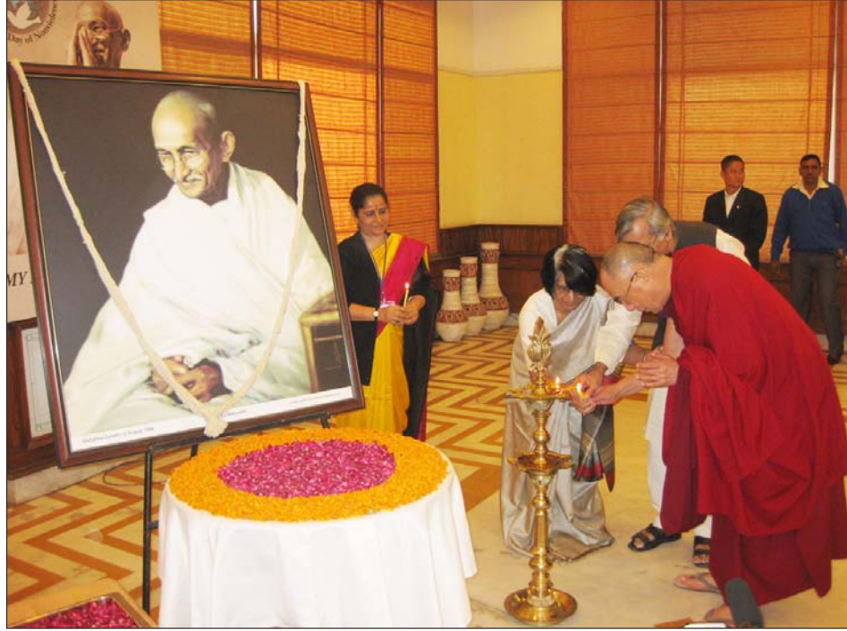
ལམ་ལོ་དོ་སྤོང་སྤྲུག་གིས་བདག་ཉིད་ཆེན་པོ་སྐྱེན་ཉིད་རྗེས་འབྲང་སྤོལ་གྱི་འཕེལ་རྒྱ་དོན་འཛིན་ལུ་གི་ཡོད་སྟོར་བཀའ་སློབ་སྦྱུལ་དོན།

བསྐྱེད་པོ་མཛད་པ་དང་ཆབས་ཅིག་སྐྱེན་ ཚོགས་དེར་ཕེབས་པའི་སྐྱེན་ཉིད་རྗེས་འབྲང་པ་ ཚོའི་བྱས་རྗེས་བརྒྱུད་མཐོན་པོ་གང་ཉིད་ལ་རང་ བཞིན་གྱི་སྤྱིང་སྤོ་བས་འཕེལ་བ་དང་རྒྱ་གསུམ་ དགྲུས་ཚོར་ཆེན་པོ་བྱུང་བཞིན་པ་གཏའ་སློབ་ཕེབས་ ཡོད། མཐོན་པོ་གང་ཉིད་གྱིས་ད་དུང་འཛམ་ གླིང་ནང་མང་གཙོའི་རྒྱལ་ཁབ་ཆེ་བོས་རྒྱ་གར་ ལ་ལོ་དོ་སྤོང་སྤྲུག་ནས་ཡོད་པའི་བཟང་པོའི་ཡོན་ ཏན་ཁག་ལ་བསྐྱེད་པོ་མཛད་པ་དང་མི་ རབས་གཞིན་པ་ཚོས་ཙུ་ཆེན་རིག་གཞུང་བཟང་ པོ་དེ་མི་ཉམས་རྒྱུན་འཛིན་བྱེད་དགོས་པའི་ལམ་ སྟོན་དང་སྐྱེད་པོ་གང་ཉིད་རྒྱ་མཚན་གཉིས་ཀྱི་ ཐོག་ནས་ Son of India རྒྱ་གར་གྱི་འཕེལ་ རྒྱ་དོན་འཛིན་ལུ་གི་ཡོད་སྟོར་བཀའ་སློབ་སྦྱུལ་ དོན། “རྒྱ་མཚན་དང་པོ་ནི་ཤེས་བྱའི་གཞི་རྩ་ དེ་རྒྱ་གར་ནས་བྱུང་བ་ཞིག་དང་། གཉིས་པ་དེ་ འདས་པའི་ལོ་དོ་རྒྱ་བཅུའི་རིང་རྒྱ་གར་གྱི་ཟས་ བཟས་ཏེ་འཚོ་གནས་བྱུང་བ་བཅས་ལ་བརྟེན་དོས་ རང་རྒྱ་གར་གྱི་འཕེལ་རྒྱ་ལུ་ཆགས་ཡོད་ཅེས་བཀའ་ སློབ་ཕེབས་ཡོད། དེ་རྗེས་ཐའེ་ལན་ནས་ཕེབས་པའི་ སྤྱི་ཚབ་གྱིས་གསུང་བཤད་གནང་རྗེས་ཐུགས་རྗེ་ ཆེ་བྱུང་བའི་གསུང་བཤད་གནང་སྟེ་མཛད་སྟོན་རྒྱལ་ ཁབ་དང་སྤོལ་རྗེས་ལམ་ལོ་དོ་སྤོང་སྤྲུག་གསུང་ གནས་མཐོན་ཁང་ལ་ཆེབས་སྐྱུར་བསྐྱུངས། དེ་ ལྟར་སྐྱེན་ཚོགས་དེ་ཉིན་གྲངས་བཞིའི་རིང་ ཚོགས་ཡོད་པར་རྒྱ་གར་ནང་གི་སྐྱེན་ཉིད་རྗེས་ འབྲང་པ་གྲགས་ཅན་མི་སྣ་ཁག་གཅིག་ཕེབས་ཡོད་ པ་མ་ཟད། སྐྱེན་ཉིད་རྗེས་འབྲང་སྤོལ་གྱིས་ གནང་མཁུག་གྱི་སྤྱི་ཚོགས་ཞབས་ལུ་བ་དང་། ལས་འགུལ་བ། མཁས་དབང་སོགས་ཀྱང་ཕེབས་ ཡོད། ད་རེས་ཀྱི་སྐྱེན་ཚོགས་དེའི་ཐོག་བོད་མི་ལས་ འགུལ་བ་ཁག་གཅིག་ཀྱང་མཉམ་ལྷུགས་གནང་ ཡོད་པ་བཅས།