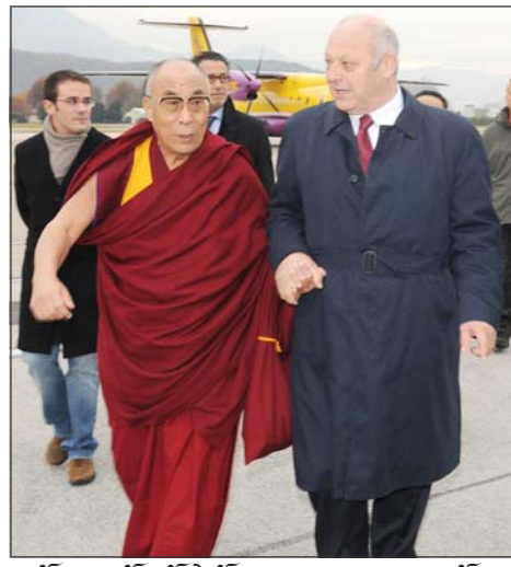
ལོག་ས་མཚོག་སྤོ་རེ་ལ་གནས་ཐང་དུ་ལྷ་བས་སོར་ འཁོད་ལྷ་བས་སྤྱིད་འཛིན་མཚོག་ཐེབས་བསུར་བཅར་བ།

༡༡ སྤེལ་པོ་ ༢༠༠༧ ཟླ་བ་ ༡༡ ཚེས་ ༡༤ ཉིན་ལོག་ས་ལྷ་བས་མགོན་ཆེན་པོ་མཚོག་སྤེལ་ རས་མཁམ་ལམ་བརྒྱུད་ཨི་ཏ་ལིའི་ཆེབས་སྐྱུར་ བསྐྱེད་ས་ཏེ་ཨི་ཏ་ལིའི་གྲོང་ཁྱེར་སྤོ་རེ་ལ་ (South Tyrol) རང་སྤྱོད་ས་ལྷུ་པོལ་རོ་ནོ་ (Bolzano) ཞེས་པའི་མངའ་སྤེལ་གནས་ཐང་དུ་ ལྷ་རྩོ་རྒྱ་ཆོད་ ༧ ཐོག་ལྷ་བས་སོར་བདེ་བར་འཁོད་ ལྷ་བས་སྤོ་རེ་ལ་སྤྱིད་འཛིན་ཏུ་ན་སྤེལ་ཏེ་ར་ (Durnwalder)མཚོག་སྤྱོད་ས་ཐེབས་བསུར་ བཅར་ཏེ་མགོན་པོ་གང་ཉིད་མཚོག་ལ་འཚམས་