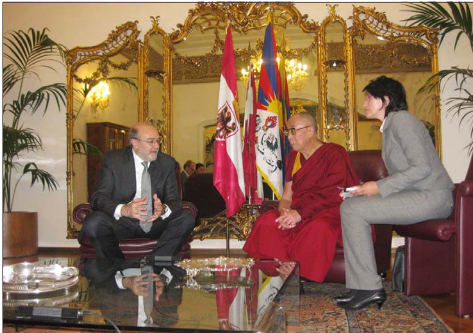
ཡུ་རོབ་ས་མཚོག་གིས་ཏེ་རན་ཏི་སྲིད་འཛིན་ཏེལ་ལི་མཚོག་དང་ཁོང་གི་གནད་ཡོད་ལས་ཀྱི་ལྷན་ཁྲིམས་པའི་མངའ་བཞུགས་པ།

ཉིན་རྒྱབ་མགོན་པོ་གང་ཉིད་མཚོག་ཏེ་ རན་ཏིའི་ (Trento) རང་སྐྱོང་ས་ཁུལ་ནང་ཡུལ་ས་ སོར་འཁོད་སྐབས་སྲིད་འཛིན་སྐྱུ་ཞབས་ཏེལ་ལི་ མཚོག་ (Dellai) ནས་ཡུ་རོབ་ས་མཚོག་ལེབས་ བསུར་བཅར་ཏེ་གདན་ཞུས་ཀྱིས་སྲིད་འཛིན་མཚོག་ ནས་ཡུ་རོབ་ས་མཚོག་ལ་གུས་བརྩེའི་གྲང་ཚོགས་ཀྱི་ གསོལ་སྟོན་བཤམས་ཡོད། དེ་རྗེས་ཡུལ་དེར་གནས་ སྡོད་མི་རིགས་མཐུན་ཚོགས་ཀྱི་ཚོགས་མི་ ༤༠ ཙམ་ཡོད་པ་རྣམས་ལ་མངལ་ཁ་དང་བཀའ་སློབ་ བཀའ་དྲིན་ཆེ་བ་སྦྱུལ་གནང་མངའ་རྗེས་ཨི་ཏེ་ལི་ འོད་དོན་རྒྱབ་སྐྱོར་ཚོགས་མི་ཁག་གཅིག་ལ་མངལ་ ཁ་སྦྱུལ། དེ་དག་གྲུབ་རྗེས་རྒྱ་ཚོང་ ༡༡༥༠ ཐོག་ སྲིད་འཛིན་ཏེལ་ལི་མཚོག་དང་ཁོང་གི་གཞུང་འཛིན་ ལས་དོན་གཙོ་འཛིན་པ་བཅས་དང་ཟུར་མངལ་གྱིས་ གསུང་མོལ་སྦྱག་པོར་མངའ་ད།