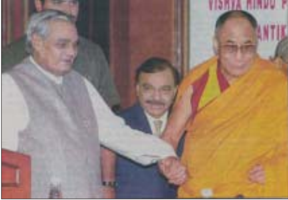
ལགོང་ས་མཚོག་དང་སྤྱི་ཚུལ་རྣམས་གཉིས་སྤྱི་ཚུལ་སྤེལ་བཞེས་པ།

སུམ་བརྒྱུད་ཉེ་བའི་ཉིན་བཞིའི་ཆོགས་འདུའི་དབུ་འབྲེད་མཇུག་སྤོང་གཙོ་མགོན་དུ་ལགོང་ས་མཚོག་དང་། རྒྱ་གར་གྱི་སྤྱི་ཚུལ་ལ་ཏར་བལ་ཇེ་བལ་རྣམས་གཉིས་གདན་ཞུ་གནང་བ་ལྟར་ལགོང་ས་མཚོག་དང་སྤྱི་ཚུལ་རྣམས་གཉིས་དུམ་པེ་