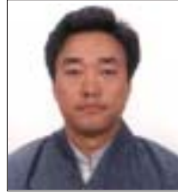
འོས་ཐོན་ཨ་རི་དང་ཁེ་ཇ་ཌའི་སྤྱི་འཐུས་ བཏུན་འཛིན་ཚོས་ལྷན་ལགས་ འོས་གྲངས་ ༤༤༧

(འོས་ཐོན་སྤྱི་འཐུས་རྣམས་གཉིས་ཀྱི་བཞུགས་ཡུལ་དང་ལོ་རྒྱུས་སྤྱི་ཚེ་ དགུ་པའི་ཤེས་བྱའི་ནང་བཀོད་ཟིན་པར་བརྟེན་འདིར་བཀོད་མེད།)