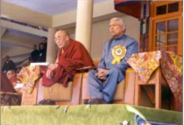
ཡུལ་ས་མཚོགས་དང་སྲིད་སྲོལ་རྣམས་གཉིས་ནས་དཀྱིས་སྦྱོར་འཁུལ་སྦྱོར་ལ་དཀྱིས་པའི་སྦྱོར་ ཞིབ་གནང་བཞིན་པ། སྦྱོར་པར་བརྟེན་མཁན་བརྟེན་རྣམས།

འཁོར། རང་དབང་ཅན་གྱི་སྤྲོ་ཆོན་གྱི་འགན་འཛིན་རྣམས་ཀྱི་འཇུག་རྒྱུ་ ལས་བཅས་ནས་མཇུག་པའི་ཞུགས་པར་ཐུགས་སྦྱོར་སྦྱོར་སྦྱོར་སྦྱོར་སྦྱོར་སྦྱོར་སྦྱོར་ པར་གསུངས་རྗེས་བཀའ་སྦྱོར་དུས་དྲན་གོ་སྦྱོར་གྱི་ཆོགས་ཆུང་ནས་ཆོ་གའི་དབུ་ བཞུགས་དང་། ལྷ་ཆེན་རྣམས་ཀྱི་ཆོག་གུ་བཅས་ལ་ལེགས་དར་སྦྱོར་ཡོན་དང་། འདུས་དམངས་ལ་མང་འགྲེད་ཡུལ། ཆོག་གུའི་དབུ་བཞུགས་སོགས་ལ་ཐུགས་སྦྱོར་ དང་། ལེགས་དར་སྦྱོར་རྗེས། ཀའ་ཁྲི་སྦྱོར་སྦྱོར་བརྟེན་འབར་མ་དང་། རིས་མེད་