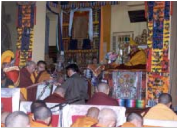
དཔལ་ས་སྐྱའི་ཁྲི་འཛིན་རིན་པོ་ཆེ་ནས་མཇུག་ལུགས་བཤད་དང་སྐྱེ་འབྲས་ཚོགས་གཙོ་དང་བཀའ་ ཚིག་གི་པ་ནམ་གཉིས་ནས་ཚོམས་ལུང་དུ་གསུངས་པའི་བཞིན་པ། ལྷ་པར་བརྗོན་མཁའ་བསྟན་ཚམ།

བའི་དབུས་སུ་མཐོང་གོལ་མཚན་དཔེའི་དགྲིལ་འཁོར་ཉི་མ་འབྲུམ་གྱི་གཟི་བྱིན་ དོམས་བཞིན་པར་དལ་བུས་བྱོན་ཏེ་གཙུག་ལག་ཁང་གི་མི་འཛིགས་གདོང་ལྟས་