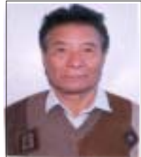
འོས་ཐོན་དབུས་གཙང་སྤྱི་འཐུས་ རྣམ་རྒྱུལ་དབང་འདུས་ལགས་ འོས་གྲངས་ ༤༡༦༠

འཛིན་དང་འབྲེལ་སྐྱགས་ཇི་ཅེ་རྒྱ་རྒྱ་དང་། ས་གནས་སོ་སོར་མཐའ་བསྟོམས་ གསལ་བསྐྱགས་གནང་སྟོ་རྣམས་ངེས་གནང་དགོས་པ་བཅས་དེ་དོན་དགོངས་ འཇགས་ལྷ། འོས་བསྐྱེལ་ལས་ཁང་ནས་ ༡༠༠༡ ཟ࿳་ ༡༡ ཚེས་ ༡༣ ལ།།