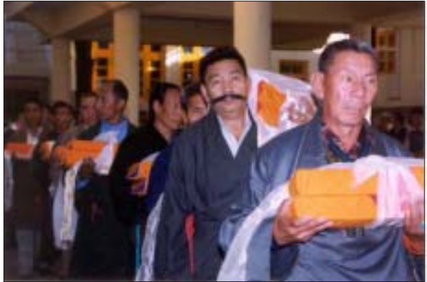
ས་གནས་ཁག་ནས་ཐེབས་པའི་རང་བདེན་ཆོགས་ཆུང་ཆོགས་གཙོ་རྣམས་ནས་འདུལ་བ་ སྦྱོར་བརྟེན་ཞུ་བཞིན་པ། པར་པ་བརྟེན་རྣམས།

དེ་རྗེས་མངའ་སྡེའི་སྲིད་སྲོལ་མཚོགས་འཚོམས་འདྲིའི་གསུང་ བཤད་གནང་ཞིང་ཁོང་གིས་གསུང་དོན། གུས་པར་འོས་པའི་ཡུལ་ས་ཏུ་ ལའི་ལྷ་མ་མཚོགས་དང་། ལྷ་ཆེན་རྣམས་ཀྱི་བོད་མི་སེར་སྦྱོར་ལོ་མོ་དང་། སྦྱོར་ ཡུག་བཅས་ལ་ཞུ་རྒྱུར། དེ་རིང་གིན་ཏུ་གལ་ཆེའི་མཛད་སྦྱོར་འདིའི་ཐོག་འཕགས་ བོད་གཉིས་ཀྱི་རྒྱལ་སྦྱོར་མཉམ་གཏོང་གནང་བ་འདིས་ངོས་ལ་དཀྱིས་བས་བསལ་སེམས་ འགུལ་ཆེན་པོ་ཞིག་ཐེབས་བྱུང་བར་མ་ཟད། དེ་མ་ལའི་རི་རྒྱུད་ཀྱི་ཡང་སྦྱོར་དུ་ གནས་པའི་བོད་གངས་ཅན་རྫོང་ས་ཀྱི་ཡུལ་གྱའི་ནང་དངོས་སུ་སྦྱོར་བས་པ་ལྟ་བུའི་ ཆོར་སྦྱང་གི་དགའ་སྦྱོར་ཆེན་པོ་ཞིག་བྱུང་། དེ་མ་ལའི་རི་རྒྱུད་ཀྱི་རི་བྱག་