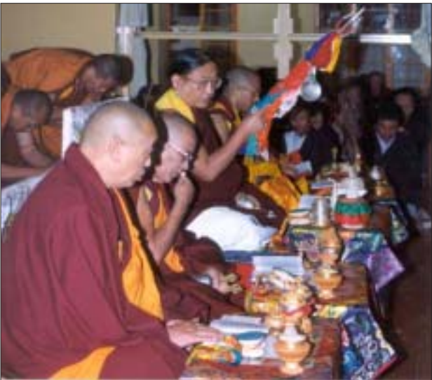
མཛེན་ཚམས་ནས་བཞུགས་པའི་ལྷ་པར་ཚོགས་གསུངས་པའི་བཞིན་པ། ལྷ་པར་བརྗོན་མཁའ་བསྟན་ཚམ།

བཏེགས་པའི་གསེར་ཁྲིར་ཡལ་བས་བྱུང་འཁོད་པ་དང་། ཚོགས་གྲའི་དབུ་བཞུགས་ འཁོར་རིགས་བསྟན་པའི་བདག་པོ་དཔལ་ས་སྐྱའི་ཁྲི་འཛིན་རིན་པོ་ཆེ་མཚོག་ནས་ སྐྱེ་བུ་དང་འབྲེལ་བྱེད་ན་རིང་བའི་རྩ་རྩེ་ལོ་བའི་མདངས་ལྟར་རྒྱུང་འབྲུལ་ལྷས། ནམ་གྲའི་ཚོགས་གྲ་ནས་རྟོང་ཉིད་ཉིད་རྩེ་མ་དང་། རྒྱུན་ཆགས་གསུམ་པ། རྫོབ་ དཔོན་གྲགས་རྩེ་ཅན་གྱི་གྲགས་དམ་གནས་ནས་བསྐྱེད་པའི་གསོལ་འདེབས་དབུ་ བསྐྱེད་ཀྱི་ཚང་མས་རྩུབ་གསུངས་གནང་། རྟེན་འབྲེལ་གྱི་གསོལ་ཇ་བཞེས་འབྲས་ ཕེབས། སྐུན་ཚོགས་གྲ་ལོ་མོའི་བྱིན་འདེབས་དང་། མཁའ་འགྲོ་རྣམས་གར་ སྐབས་ཀྱིས་རྩེ་རྫོང་དཔོན་ཚེན་པོའི་བཞུགས་ཁྲིའི་མདུན་དུ་འཁོད་ཅིང་། རང་ རང་གི་དར་རྩེ་བཟུང་བ་དང་། ཚོགས་ཚོགས་ཀྱིས་དང་བསྐྱེད་དབུ་བཞུགས་ས་