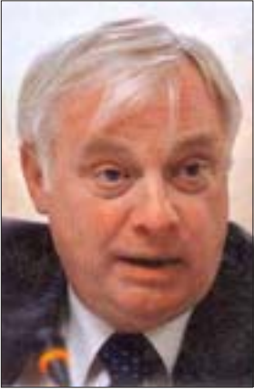
སྐྱེ་ཞབས་ཁིར་སི་པ་ཉིན་མཚོག

རྗེས་གསུང་འགོད་པས་སྐྱེ་ཞབས་ཁིར་སི་པ་ཉིན་མཚོག་ལ་མཇུག་འཕྲད་ ཀྱི་གནད་དོན་སྐོར་བཀའ་འདྲི་ལྟ་སྐབས་གསུང་དོན། དེར་སྐབས་འཇུག་