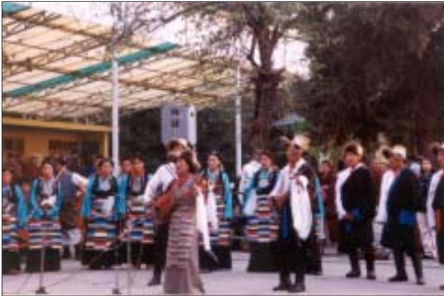
འབྲུབ་སྟོན་པ་ཁག་ནས་གཞས་སྐྱ་གཟུགས་འབྲུལ་ལུ་བཞུགས་པ། པར་པ་བསྟན་ཚམས།

མགོན་ཆེན་པོ་མཚོག་དང་། བླ་ཆེན་ཚམས་པ། རྒྱ་གར་གྱི་སྐྱེ་མགོན་སོགས་ཟུག་སྐྱེ་མགོན་ །ཁང་དུ་གདན་འདྲན་ཞུས་ནས་ཉིན་གུང་ལྷགས་སློན་གསོལ་སྟོན་གཟབ་རྒྱས་འདེགས་འབྲུལ་