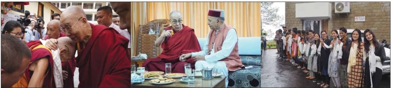
ལྷི་ཁོར་ཡགོང་ས་ཡུལ་སྐབས་མགོན་ཆེན་པོ་མཚོག་མ་རྒྱ་ལིའེ་འོན་མངའ་རིས་གྲུ་ཚང་དུ་ཆེབས་སྐྱུར་བསྐྱུངས་སྐབས་དད་ལྷན་ མང་ཚོགས་ནས་ཐེབས་བསུ་གནམ་རྒྱས་ལུས་པ།