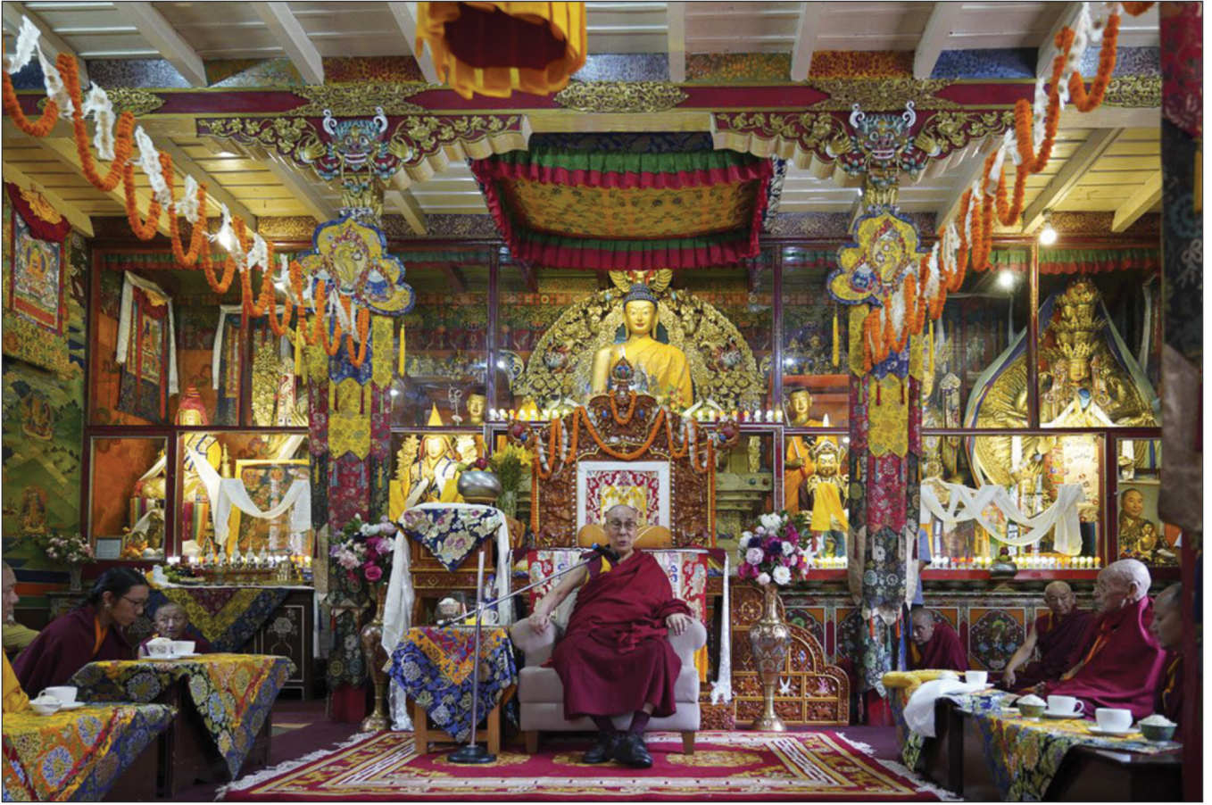
ལྷི་ཁོར་ཡགོང་ས་ཡུལ་སྐབས་མགོན་ཆེན་པོ་མཚོག་མ་རྒྱ་ལིའེ་འོན་མངའ་རིས་གྲུ་ཚང་དུ་ ཆེབས་སྐྱུར་བཀའ་འིན་བསྐྱུངས་པ།