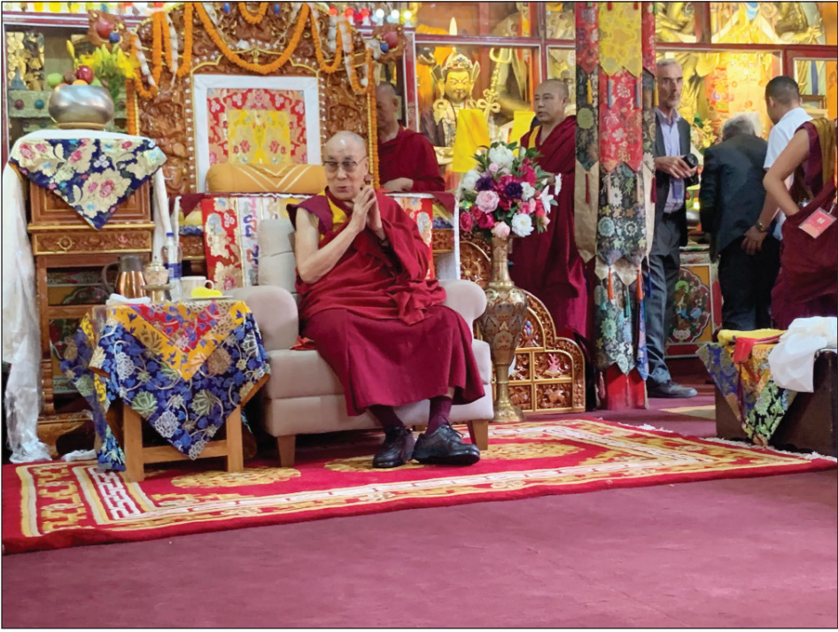
བདེ་ལེགས་ཡོད།

དེ་རིང་འདིར་བྱེས་ཀྱི་མངའ་རིས་གྲ་ཚང་དུ་འབྱོར་བ་རེད། དུགས་པོ་གྲ་ཚང་པར་སྤོགས་སུ་ཡོད། རིན་པོ་ཆེ་མཚོག་གིས་མངའ་རིས་གྲ་ཚང་ཞིག་འཇུགས་ཐུབ་ན་ཞེས་པར་འདིར་མ་ནཱ་ལེར་དགེ་ལུགས་དཔོན་པོ་ཞིག་ཡོད་པ་དེ་མངའ་རིས་གྲ་ཚང་བཟོས་ན་ཞེས་ཉམས་པ་སྐྱར་གསོ་བྱུང་བ་རེད། མངའ་རིས་གྲ་ཚང་འདི་མངའ་དུགས་རྒྱལ་གསུམ་ཞེས་ཡུལ་དབང་སྐྱེ་ལྡང་རིམ་བྱོན་དང་དམིགས་བསལ་འབྲེལ་བ་ཡོད་པ་རེད། མངའ་རིས་གྲ་ཚང་ནི་དགེ་འདུན་རྒྱ་མཚོས་གསར་དུ་བྱས་བཏབ་པ་ཞིག་དང་། དེ་ཡང་མངའ་རིས་སྤོགས་ནས་གྲ་རྒྱན་གང་འཚམ་ཡོད། དགེ་འདུན་རྒྱ་མཚོས་པོད་དུ་གསར་འཇུགས་གནང་བའི་འོན་མངའ་རིས་གྲ་ཚང་ཞེས་པ་འདི་བྱུང་བ་ཡིན་པ་རེད། རིན་པོ་ཆེ་བགྲུས་སོང་རེད་དེ་དུར་ཐག་འབད་ཐག་གནང་སྟེ་ཉ་ཅང་ལག་པོ་བྱུང་འདུག ཐུགས་རྗེ་ཆེ་ཞེས་ཞུ་གི་ཡིན། བཀའ་གིས་