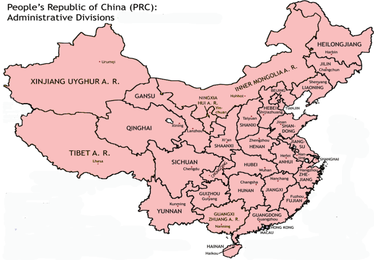
People's Republic of China (PRC): Administrative Divisions