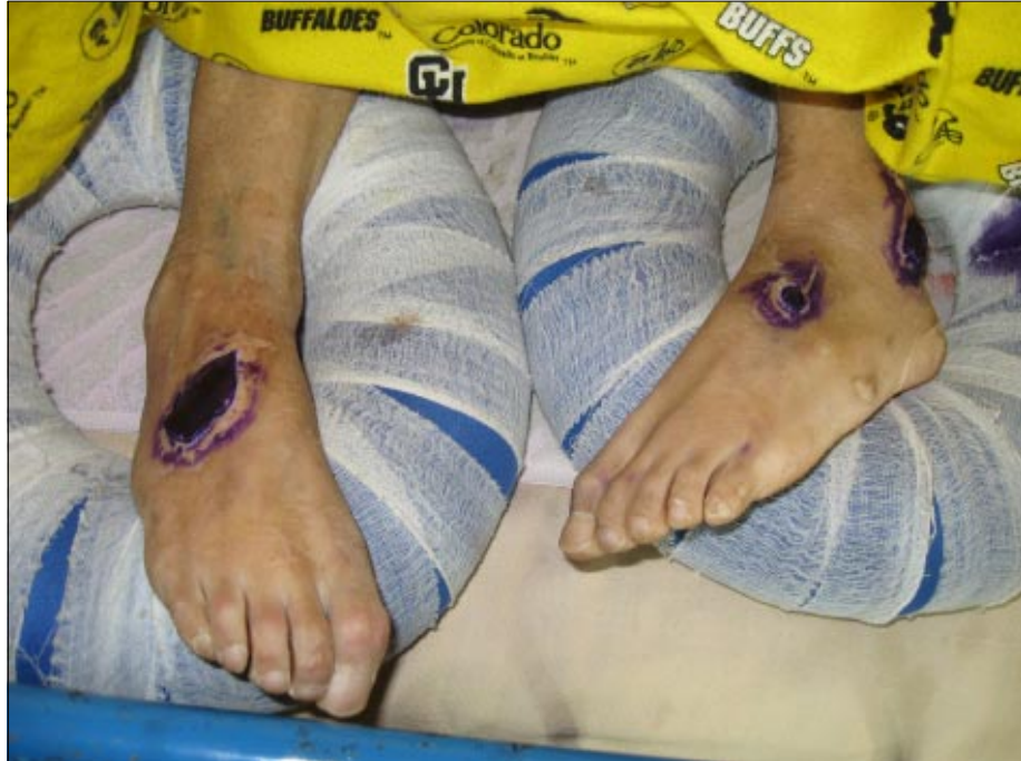
བརྟུན་དར་ལགས་ཀྱི་རྒྱའི་སྤྱོད་དུ་འབྲིག་གོག་གཡོག་སྐྱེན་རྒྱས་སྐྱོན་བཅོས་པའི་གནས་སུ་ལ་བའི་ཚུལ་ཡོད་པ་

བོད་པའི་སྐོམ་རྒྱུན་གྱི་ལུགས་སྐོམ་ལྟར་ལུང་ པོ་བྱ་གཏོར་བྱེད་སྐབས་བརྟུན་དར་གྱི་དེའི་མགོ་ དང་། མཁལ་མའི་སྤོང་ཉེས་དུང་བཏང་བའི་རྒྱ་ ལུལ་ཡོད་པ་མ་ཟད། རྒྱ་པ་གཡས་པའི་རྫིང་ཁའི་ སྤོང་དུ་གཟེར་མ་ཡང་བཅུགས་ཡོད་པ་བཅས་ བཏང་ན་ཡིད་ཚེས་དཀའ་བའི་གནས་ཚུལ་སྐྱེན་ སང་ཞུས་པ་རྒྱུས་དངོས་བདེན་ཡིན་མེན་བརྟུན་ འཕྲིན་འོད་ལ་གཟིགས་རོགས་གནང་།